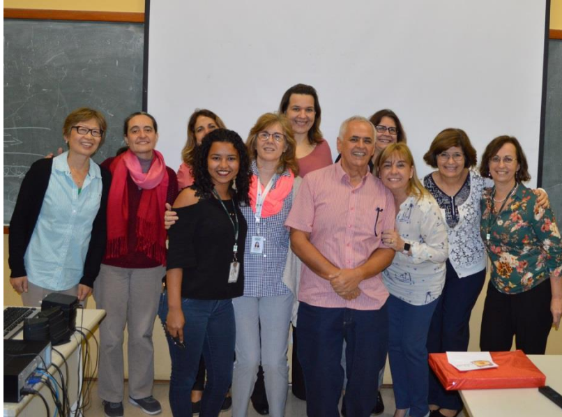
Equipe da Disciplina de Pediatria Geral e Comunitária